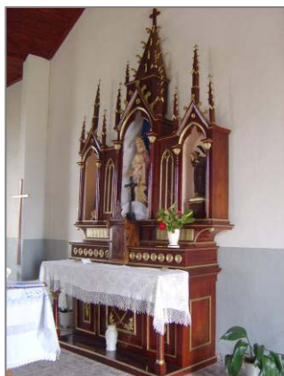
Vista geral do altar-mor.