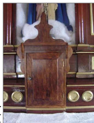
Detalhe do Sacrário.