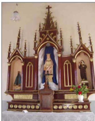
Vista da porção superior do altar-mor.