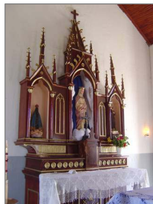
Vista geral do altar-mor.