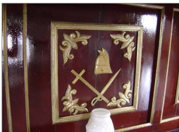
Detalhe dos símbolos que ornamentam o altar.