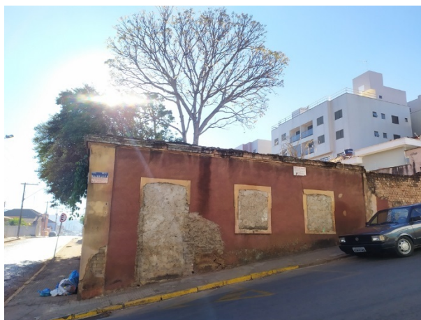
Imagem 02: ruínas da edificação demolida. Agosto de 2020. Bárbara Pereira Mançanares.