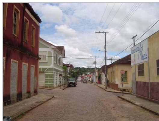
Rua Ferreira Prado FOTOS: Alexandre Borim, maio/2005.