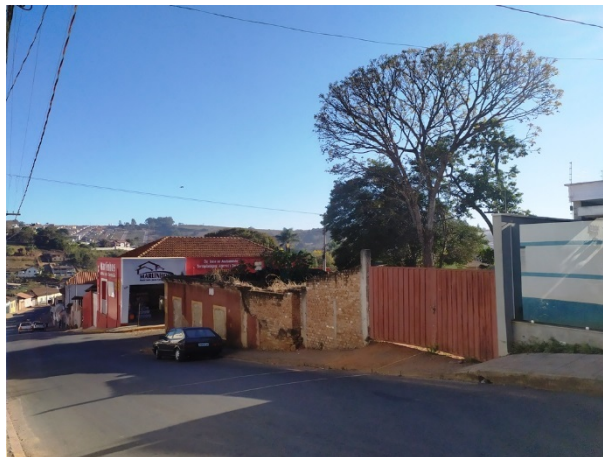
Imagem 01: ruínas da edificação demolida. Agosto de 2020. Bárbara Pereira Mançanares.