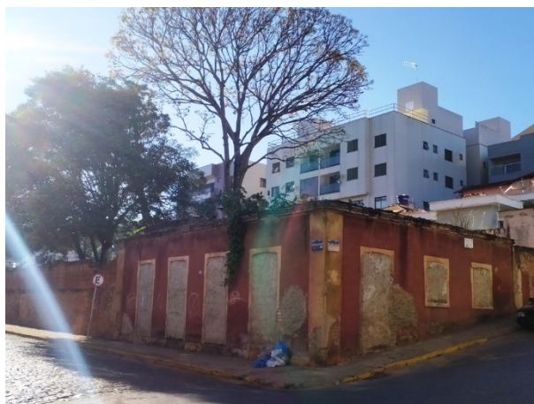
Imagem 03: ruínas da edificação demolida. Agosto de 2020. Bárbara Pereira Mançanares.