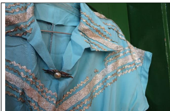
Imagem 03: Detalhe da parte da frente do vestido. Fotografia de Jaíne Diniz Corrêa, maio/2022.