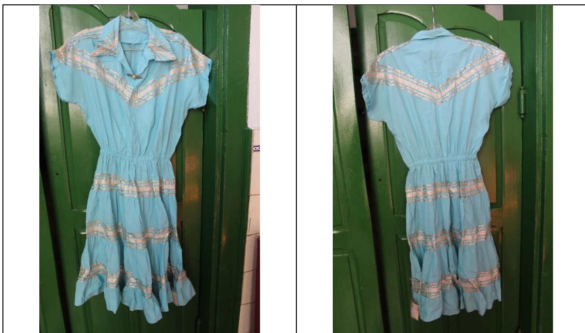
Imagem 01: Frente do vestido de Rosária Narciso. Fotografia de Jaíne Diniz Corrêa, maio/2022.