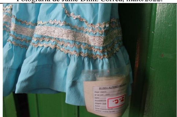
Imagem 06: Detalhe da etiqueta de catalogação da peça. Fotografia de Jaíne Diniz Corrêa, maio/2022.