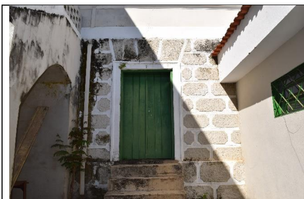
Imagem 09: Entrada da Reserva Técnica onde o vestido está acondicionado. Fotografia de Jaíne Diniz Corrêa, maio/2022.