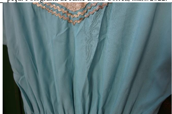
Imagem 08: Detalhe da parte de trás do vestido. maio/2022.