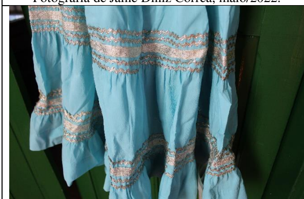
Imagem 05: Detalhe da parte da frente do vestido. Fotografia de Jaíne Diniz Corrêa, maio/2022.