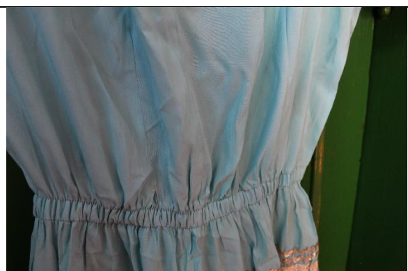
Imagem 04: Detalhe da parte da frente do vestido. Fotografia de Jaíne Diniz Corrêa, maio/2022.