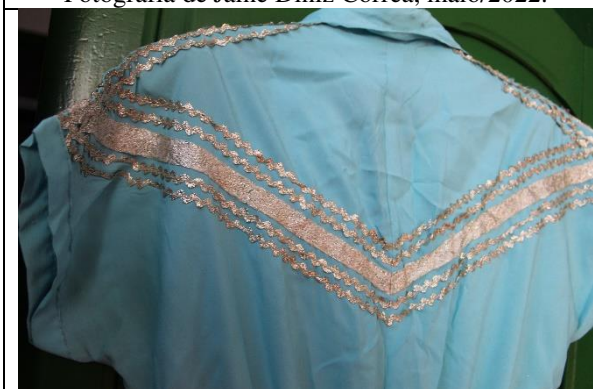
Imagem 07: Detalhe da parte de trás do vestido. Fotografia de Jaíne Diniz Corrêa, maio/2022.